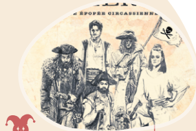
Cirque Collini Équipage recherché 30 mars 2025

Orchestre symphonique régional de l'Abitibi- Témiscamingue 2 avril 2025