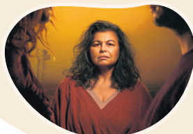
Incendies 16 avril 2025