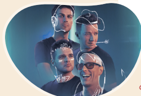
QW4RTZ 8 avril 2025

Marie-Denise Pelletier - Sous ma peau de femme 9 avril 2025